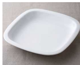
23cmスクエア深皿 1470円 サイズ 口径10.5×高さ7.5cm 満水容量 400ml