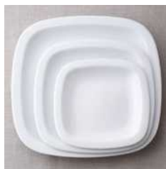
23cmプレート 1155円 サイズ 23.5×23.5×高さ2.5cm 18cmプレート 998円 サイズ 18.6×18.6×高さ2.5cm 14cmプレート 788円 サイズ 14.7×14.7×高さ2cm