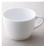
マグカップ 945円 サイズ 口径10.5×高さ7.5cm 満水容量 400ml