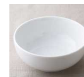
13cmボウル 683円 サイズ 直径13.4cm×高さ5.5cm