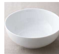
17cmボウル 1155円 サイズ 直径17.6cm×高さ6.5cm