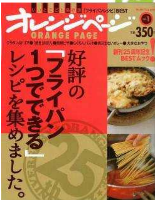
いいとこどり保存版オレンジページ