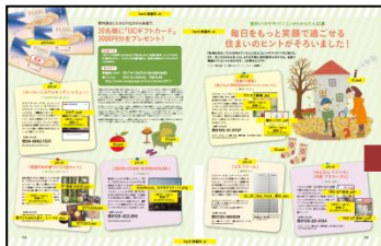
2017年11月2日売(11/17号)トメページ例