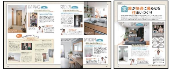
2017年11月2日売(11/17号)扉ページ例

楽しくおしゃれに暮らす工夫を実現している方の事例を、新築、リフォームそれぞれのケースで紹介する予定です。