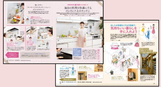
2017年11月2日売(11/17号)タイアアップページ例

タイアアップでは協賛各社様の商品特徴を分かりやすく、オレンジページで紹介。より詳しい情報を知りたい方を、資料請求へと誘導いたします。