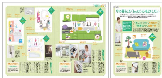
2017年6月17日売(7/2号)扉ページ

新築とリフォームの実例と共に住まいづくりのコツをご提案致します。※内容は変更になる場合がございます。