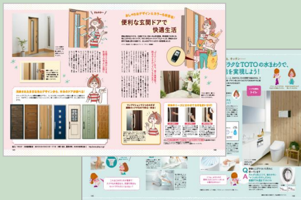
2017年6月17日売(7/2号)扉ページ

タイアップでは協賛各社様の商品特徴を分かりやすく、オレンジページが紹介。より詳しい情報を知りたい方を、資料請求へと誘導いたします。